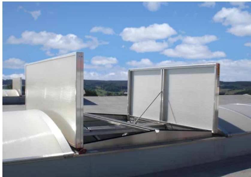
Apollo i åben og lukket position

Enheden betjenes af enten elektriske 24V aktuatorer, eller med trykluftcylindre.