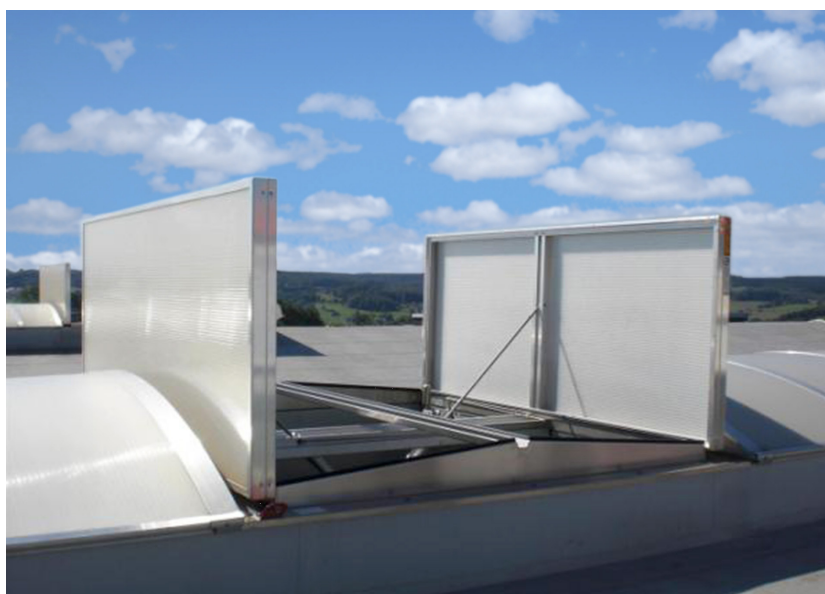
Apollo i åben og lukket position

Enheden betjenes af enten elektriske 24V aktuatorer, eller med trykluftcylindre.